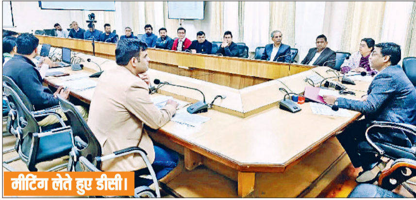
मीटिंग लेते हुए डीसी।

डीसी ने कहा कि बैठक का मुख्य उद्देश्य स्वास्थ्य सेवाओं को और प्रभावी बनाना तथा आम नागरिकों को समय पर बेहतर चिकित्सा सुविधाएं उपलब्ध करवाना है। उन्होंने विशेष रूप से गर्भवती महिलाओं के स्वास्थ्य पर ध्यान देने की आवश्यकता पर बल देते हुए कहा कि नियमित जांच बढ़ा कर जच्चा-बच्चा मृत्यु दर में