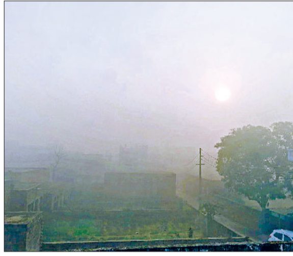
जींद। सुबह के समय छाया कोहरा।

सोमवार सुबह तक तेज ठंडी हवाओं के कारण ठंड बढ़ी रही। इसके अलावा घना कोहरा भी छाया रहा। इस दौरान इय्यता 10 मीटर के आसपास रही। दोपहर 12 बजे धूप निकली और इसके बाद कोहरा छंट गया। मौसम में अभी