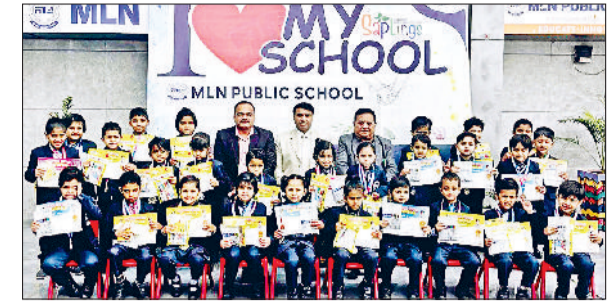
जीद। विजेता बच्चों को सम्मानित करते हुए।

अधिकार, वरिष्ठ नागरिकों के अधिकार, नालसा व हालसा की विभिन्न योजनाओं सहित अन्य कानूनी सेवाओं की जानकारी दी जाएगी।