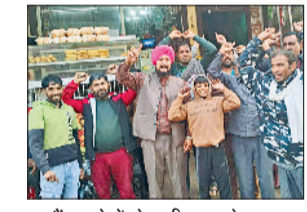
राजौद। लोगों से अपील करते हुए संघर्ष समिति के सदस्य।

राजौद। राजौद में मंगलवार को ब्लाकों की सड़क बनाने को लेकर बड़े स्तर पर विरोध प्रदर्शन किया जाएगा। इसे लेकर संघर्ष कमिटी सदस्यों द्वारा रविवार को भी महाराणा प्रताप चौक पर पेवर ब्लाक की सड़क निर्माण का विरोध-प्रदर्शन किया गया था। लोगों द्वारा विभाग से तारकोल या आर सी सी सड़क बनाने को लेकर मांग की गई थी। इसे लेकर संघर्ष कमिटी सदस्यों द्वारा सोमवार को नगरवासियों से अपील कर कहा गया कि मंगलवार को बड़े स्तर पर पेवर ब्लाक की सड़क निर्माण के विरोध में होने वाले प्रदर्शन में शामिल होकर शहर की