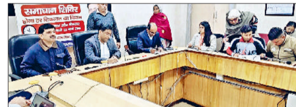
जीद। समाधान शिविर में शिकायतें सुनते हुए डीसी।