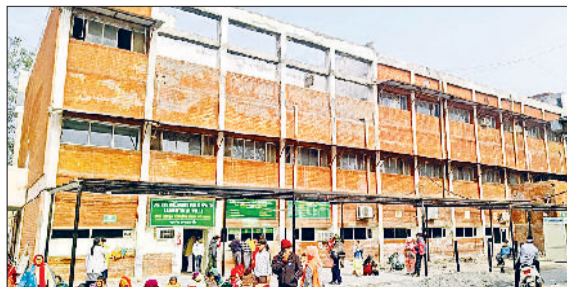
जींद। नागरिक अस्पताल के पीछे की तरफ हटाया गया शीट।